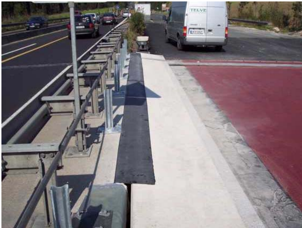
Fugenabdeckung auf der Autobahn Gummiplatte aufgeklebt mit einem Spezial - Elastomer