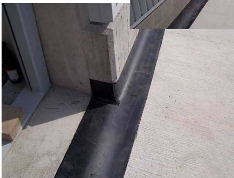
Fugenabdeckung auf der Autobahn Gummiplatte aufgeklebt mit einem Spezial - Elastomer