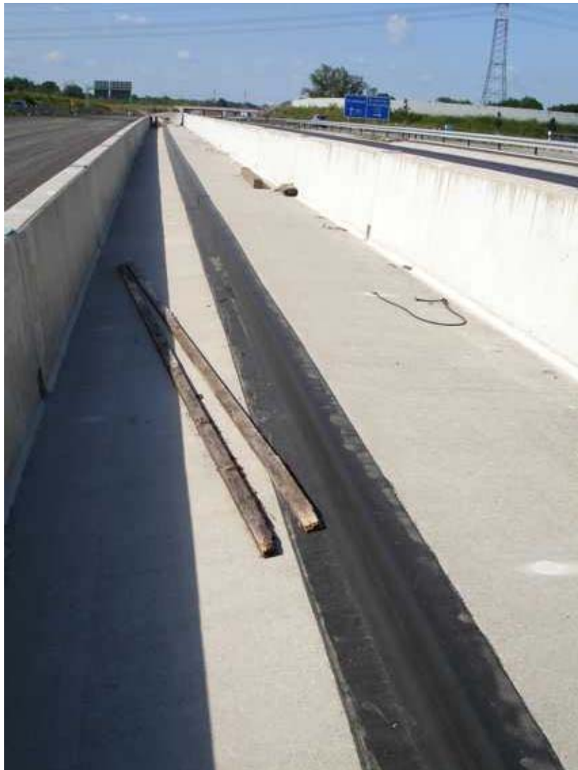
Fugenabdeckung auf der Autobahn Gummiplatte aufgeklebt mit einem Spezial - Elastomer