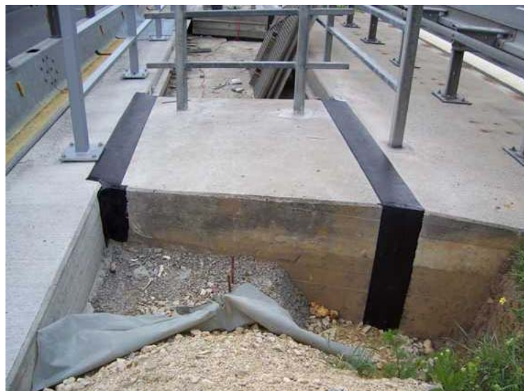
Fugenabdeckung auf der Autobahn Gummiplatte aufgeklebt mit einem Spezial - Elastomer