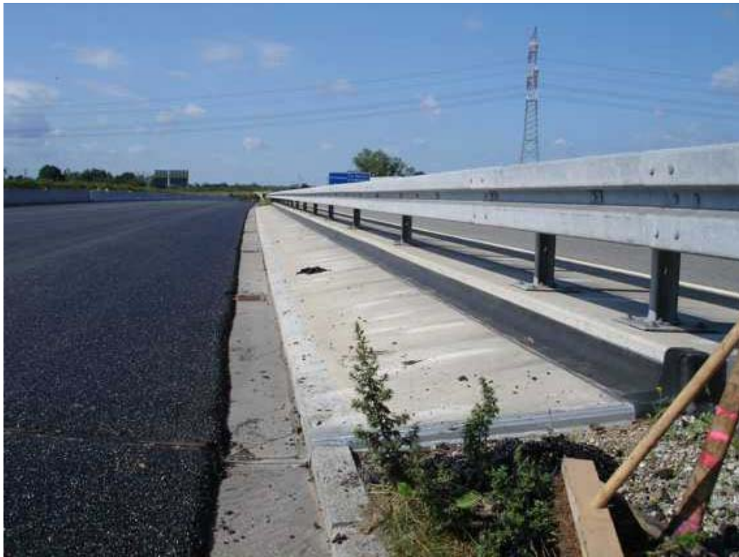
Fugenabdeckung auf der Autobahn Gummiplatte aufgeklebt mit einem Spezial - Elastomer